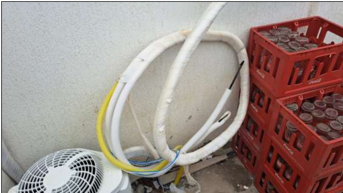
Imagem 2: Instalação Externa dos dois equipamentos