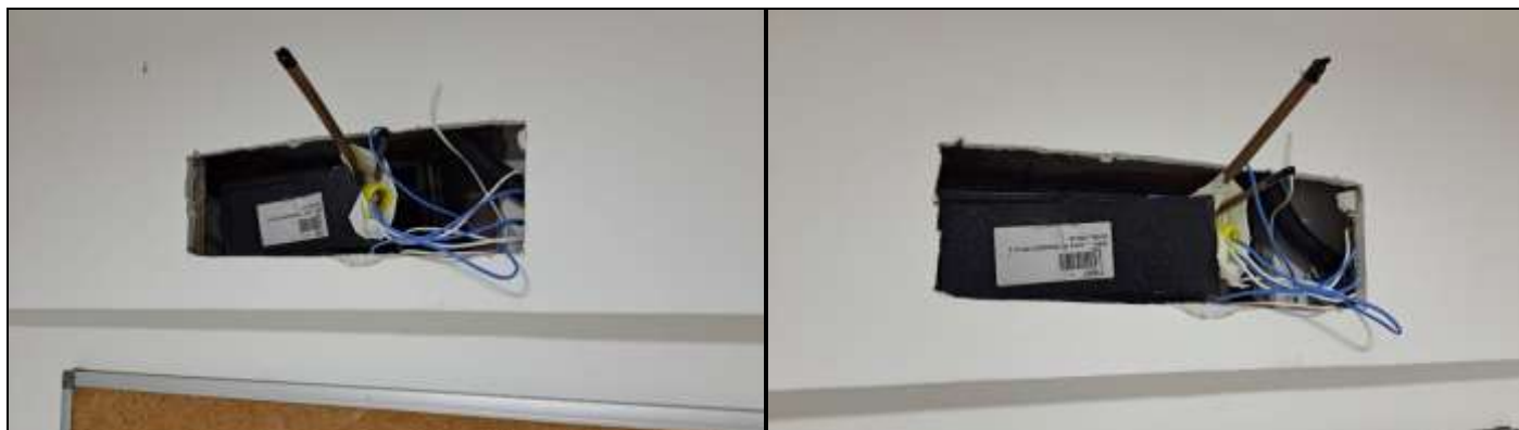
Imagem 1: Sala do administrativo - Instalação interna