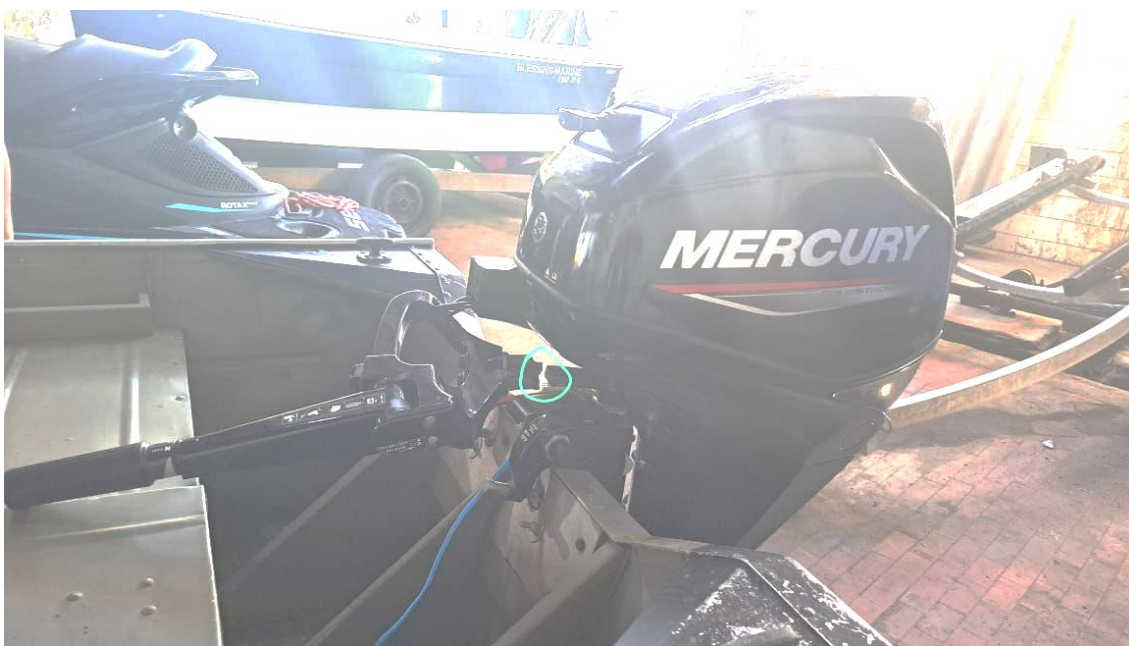
Imagem da peça danificada.

https://public-mercurymarine.sysonline.com/Default.aspx?sysname=NorthAmerica&company=Guest&NA_KEY=NA_KEY_VALUE&langIF=por&langDB=por